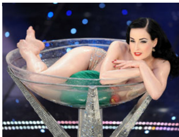
Dita Von Teese durante il bagno nella "coppa" di champagne

La misura di questo exploit si ha non solo dal numero di spettacoli che si moltiplicano ovunque, ma anche dal fiorire di corsi per imparare le tecniche di seduzione per spogliarelli mai volgari, in cui a dominare non è tanto il nudo quanto l'autoironia. Imperativo di quest'arte, infatti, è sedurre con un mix di divertimento e di glamour dal sapore retrò.